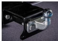
Anhängerkupplung Attelage de remorque Gancio di traino