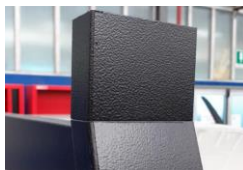
Aufsatz-Kit zu Stangenträger Kit appendice Appendici paracabina