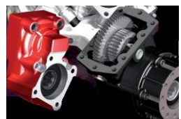
Getriebe Nebenantrieb (PTO) Prise de force de la boîte de vitesses (PTO) Presa di forza per il cambio (PTO)