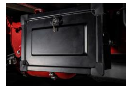
Werkzeugbox Boîte à outils Cassetta degli attrezzi