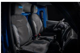
Sitzbezüge Housses de siège Coprisedili