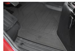
Gummimatten Tapis en caoutchouc Tappeti di gomma