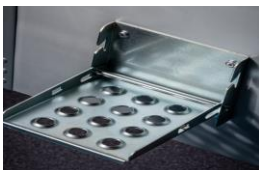
Aufstiegstritt Chassis Marche sur châssis Pedana sul telaio