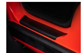
Einstiegsschutzleisten Bandes de protection des seuils de porte Striscie di protezione per soglia cabina