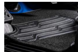
Teppich Tapis Tappeto moquette