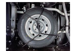
Ersatzradsatz Kit roue de secours Kit ruota di scorta

Mehr Zubehör unter: Pour plus d'accessoires, voir: Per maggiori accessori: